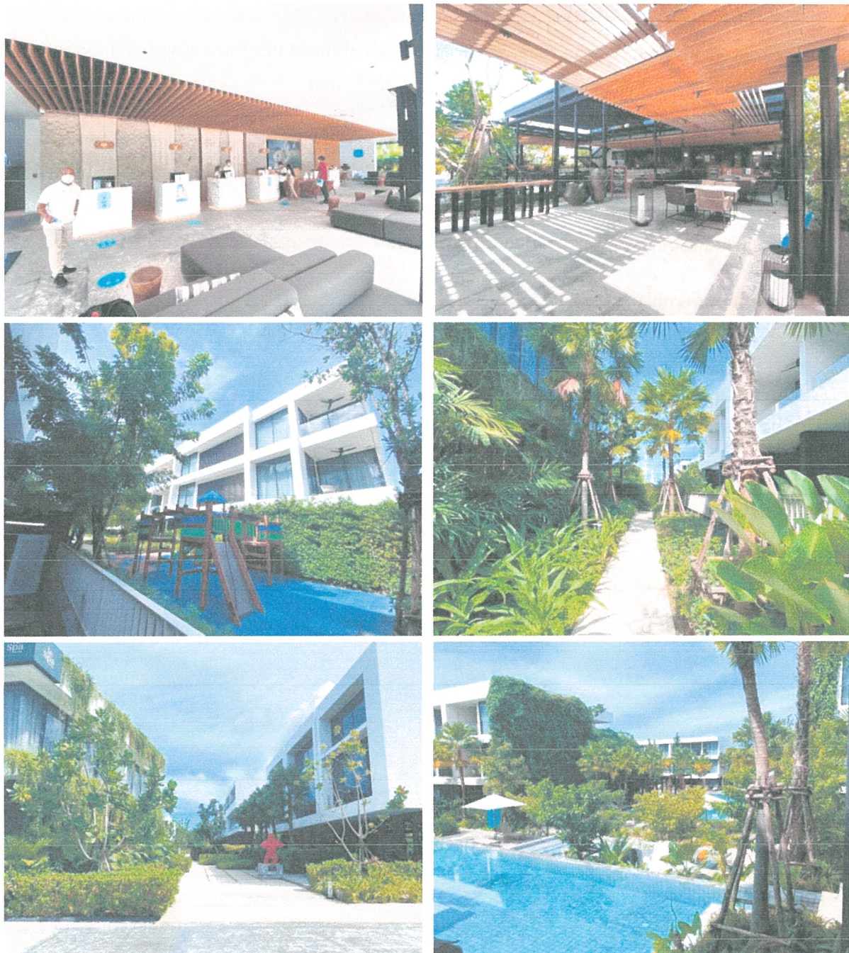
รูปภาพที่ 1.4 การใช้พื้นที่อาคาร