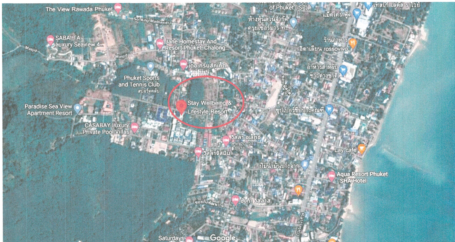
รูปภาพที่ 1.1 แผนที่ตั้งของโรงแรม สเตย์ เวลบีอิง แอนด์ โลฟิสเทล รีสอร์ท (Top View)

รายงานผลการปฏิบัติตามมาตรการป้องกันและแก้ไขผลกระทบสิ่งแวดล้อมและมาตรการติดตามตรวจสอบคุณภาพสิ่งแวดล้อม โครงการ โรงแรม สเตย์ เวลบีอิง แอนด์ โลฟิสเทล รีสอร์ท ระยะดำเนินการ ระหว่างเดือน มกราคม - มิถุนายน 2566